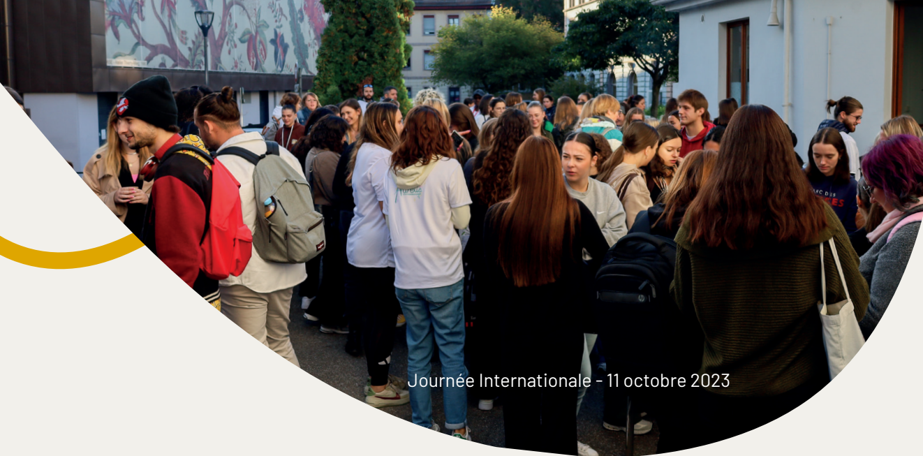
Journée Internationale - 11 octobre 2023