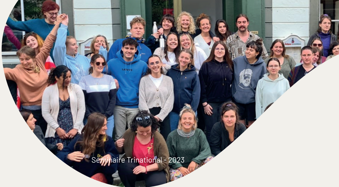
Séminaire Trinational - 2023

Il a réuni 54 étudiants dont 5 de Praxis en 2023 . L'équipe d'encadrement était composée de 6 formateurs bilingues, tous formateurs référents du programme RECOS dans leur école supérieure en travail social. Les temps de visite sur le terrain sont toujours des temps forts de ce séminaire.