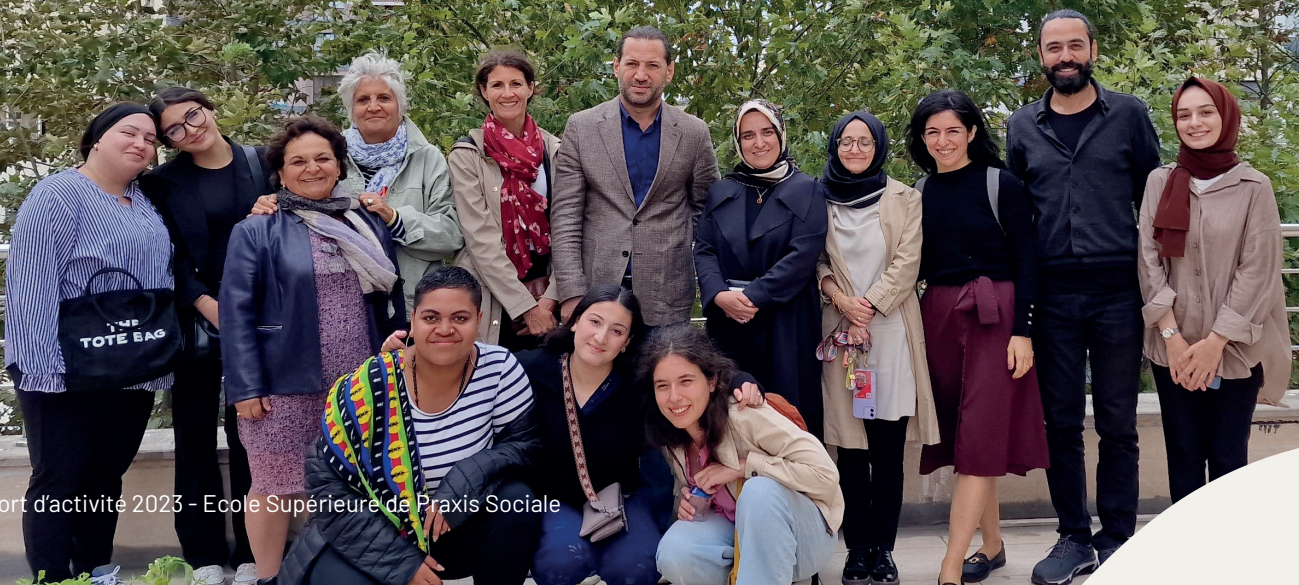
Istanbul, Turquie - Octobre 2023

7 mobilités du personnel en enseignement : 3 membres du personnel en Turquie (mai et octobre 2023) 1 invité de l'Université Medeniyet d'Istanbul en Turquie